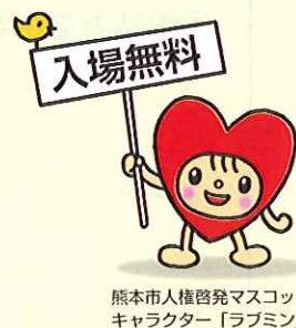
熊本市人権啓発マスコットキャラクター「ラブミン」