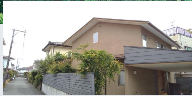
※中古住宅イメージ