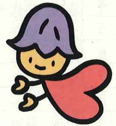
熊本県人権啓発 キャラクター 「ココロ」