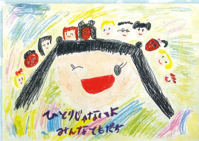
小学生の部：絵・ポスター