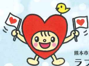
熊本市人権啓発キャラクター ラブミン