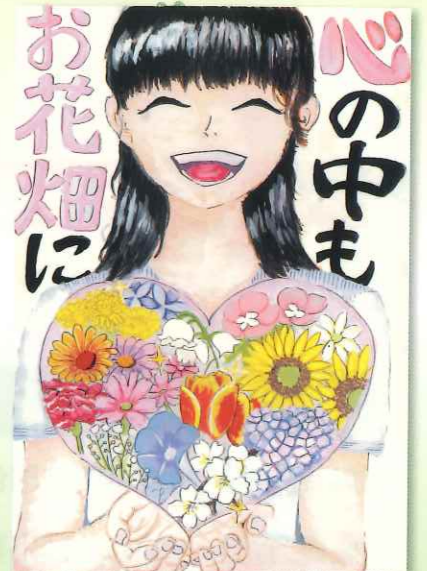
一般の部：ポスター