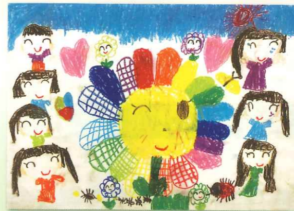
小学校の部：絵・ポスター