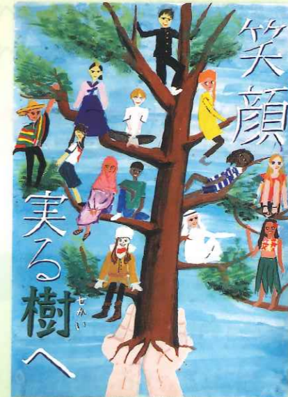
中学校の部：絵・ポスター