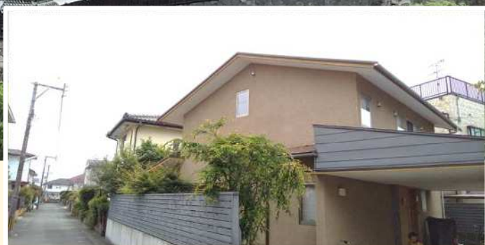
※中古住宅イメージ

居住誘導区域外から区域内へ転居する 子育て世帯・若者夫婦世帯の 中古住宅購入に 最大 30 万円！